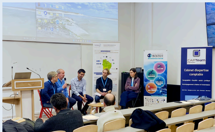
TABLE RONDE « Pour l'insertion de la recherche en entreprise »

Dans ce contexte, la SFR a organisé une table ronde réunissant des professionnels du secteur maritime, pour conclure cette journée doctorale. Cette initiative a permis d'échanger sur les aspects innovants des sujets abordés et de discuter de l'intégration de la recherche au sein des entreprises.