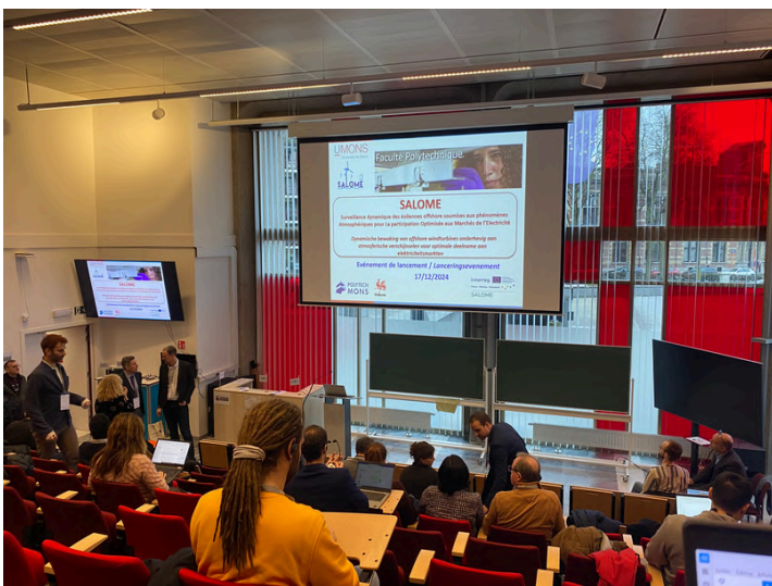
Salle Landercy, Bâtiment Rosa Parks, Université de Mons