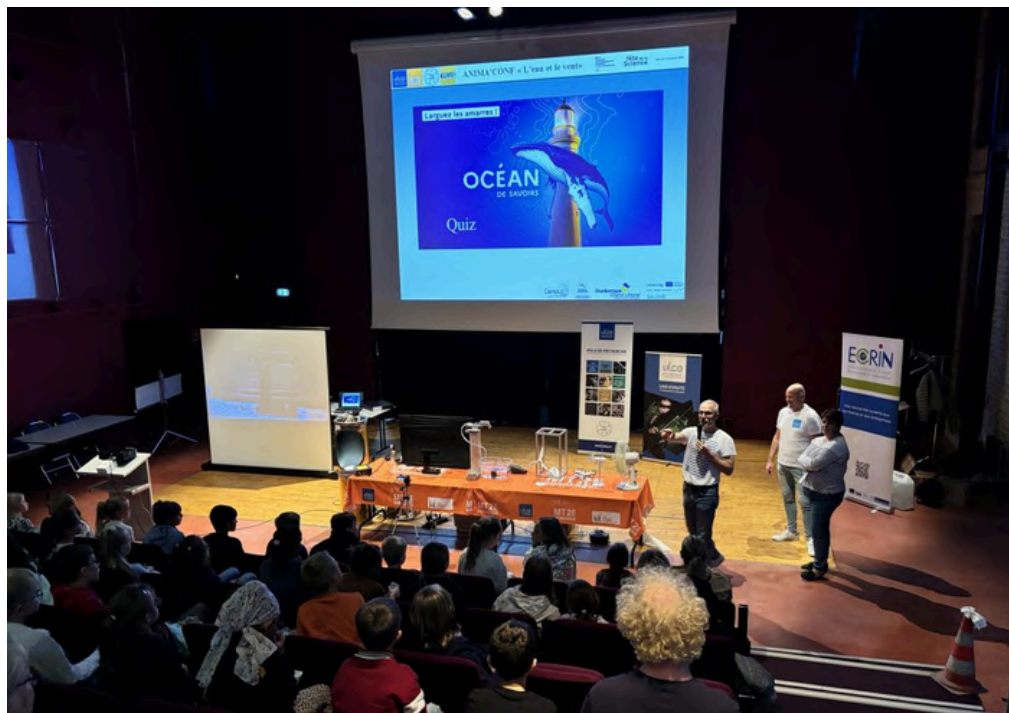
Anima'Conf (LPCA) dans l'auditorium de la Cité de la Dentelle et de la Mode