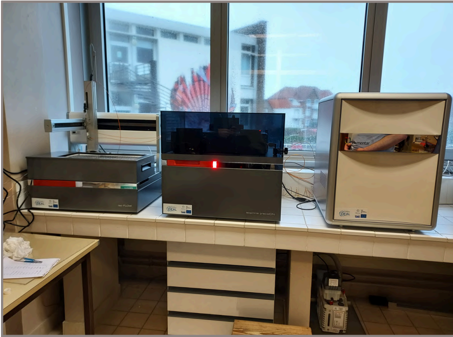
Les trois éléments acquis, de marque Elementar : le spectromètre de masse de ratio isotopique (au centre) couplé avec un analyseur carbonates (à gauche), et un analyseur élémentaire (à droite)

Le spectrophotomètre acquis dans le cadre de la P2 du CPER IDEAL (octobre 2023-octobre 2025) a été installé le 25 novembre au LOG dans le bâtiment Station Marine (Université de Lille)