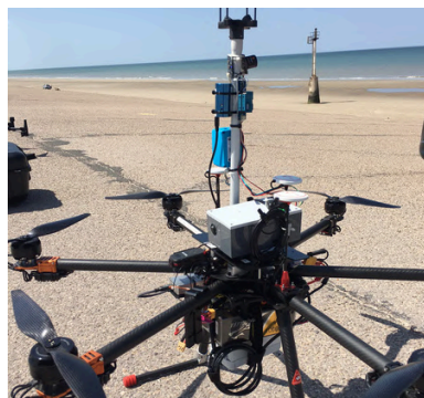
Drone ANA, Campagne ANGELA sur le front de mer 17-19 Juillet 2023

Le thème de ces journées concerne, la navigation autonome, les drones et les véhicules autonomes. Elles seront organisées en collaboration entre différents laboratoires impliqués dans la SFR Campus de la Mer et le GIS GRAISyHM . Dans ce contexte un comité scientifique composé des acteurs du domaine en région sera proposé. L'objectif de ces journées est de faire un état des lieux des activités de recherche et développement ainsi que de l'enseignement en Région Hauts-de-France.