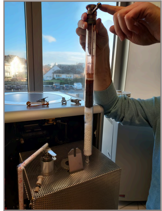
La colonne de combustion de l'analyseur élémentaire