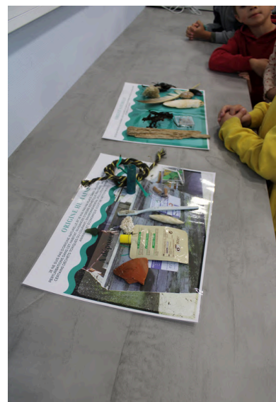
Atelier des petits OcéanoLOGue (LOG) proposé aux scolaires et au grand public

Depuis plus de 30 ans, la Fête de la science s'invite en région Hauts-de-France. "Océan de savoirs" était le thème de cette 33ème édition